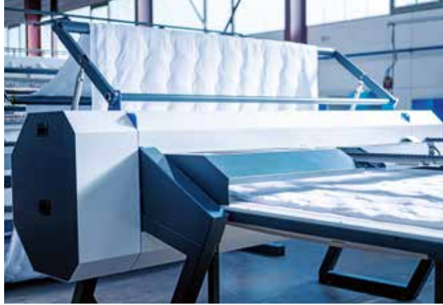
▲ Enine kesici