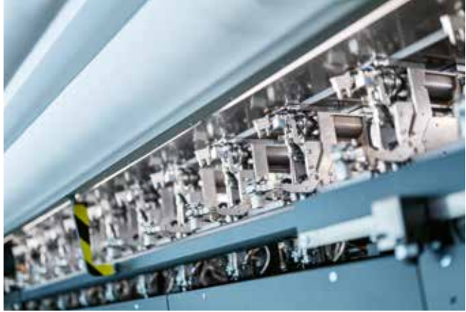
▲ Otomatik bobin değiştirici