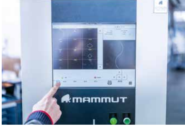
▲ Modern dokunmatik kontrol