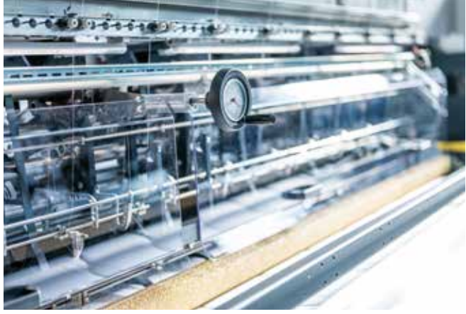
▲ Yüksekliği ayarlanabilir düğmeli ayaklar