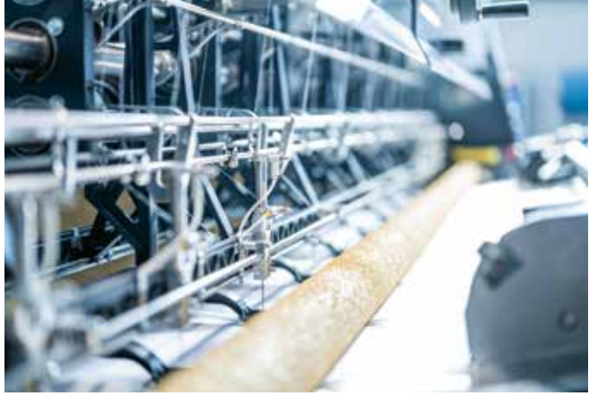
▲ Çekme kenarı iğnesi